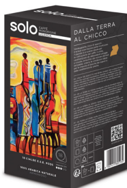
18au UGANDA 100% ARÁBICA ARMONIOSO, POTENTE, SORPRENDENTE