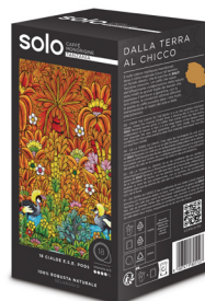
18au TANZANIA 100% ROBUSTA SALVAJE, INTENSO, CON CUERPO