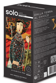
18au VIETNAM 100% ROBUSTA CREMOSO, ENÉRGICO, RECONFORTANTE